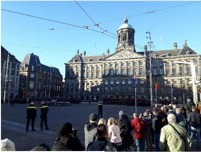
Staatsbezoek, 28 november

In dezelfde week kwam de gemeente ook met een 'Aanvalsplan Schoon'. Een plan met tien maatregelen voor een schonere stad. Prachtige ontwikkelingen waar we als Biz ook graag aan meewerken.